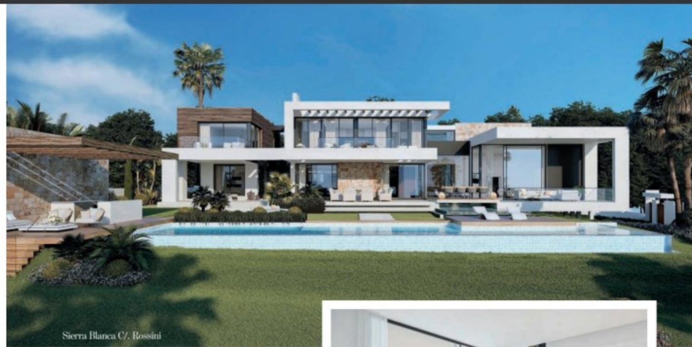
Sierra Blanca C/. Rossini

What stands out in his works: Spatiality: the richness of the spaces as an objective in the design; opposing spaces, double heights, the perspectives they aim to create, their theatricality.